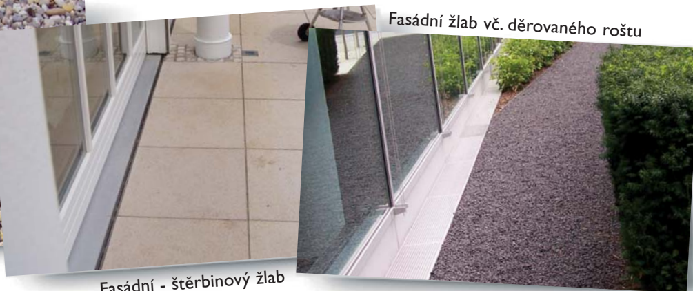
Fasádní - štěrbinový žlab